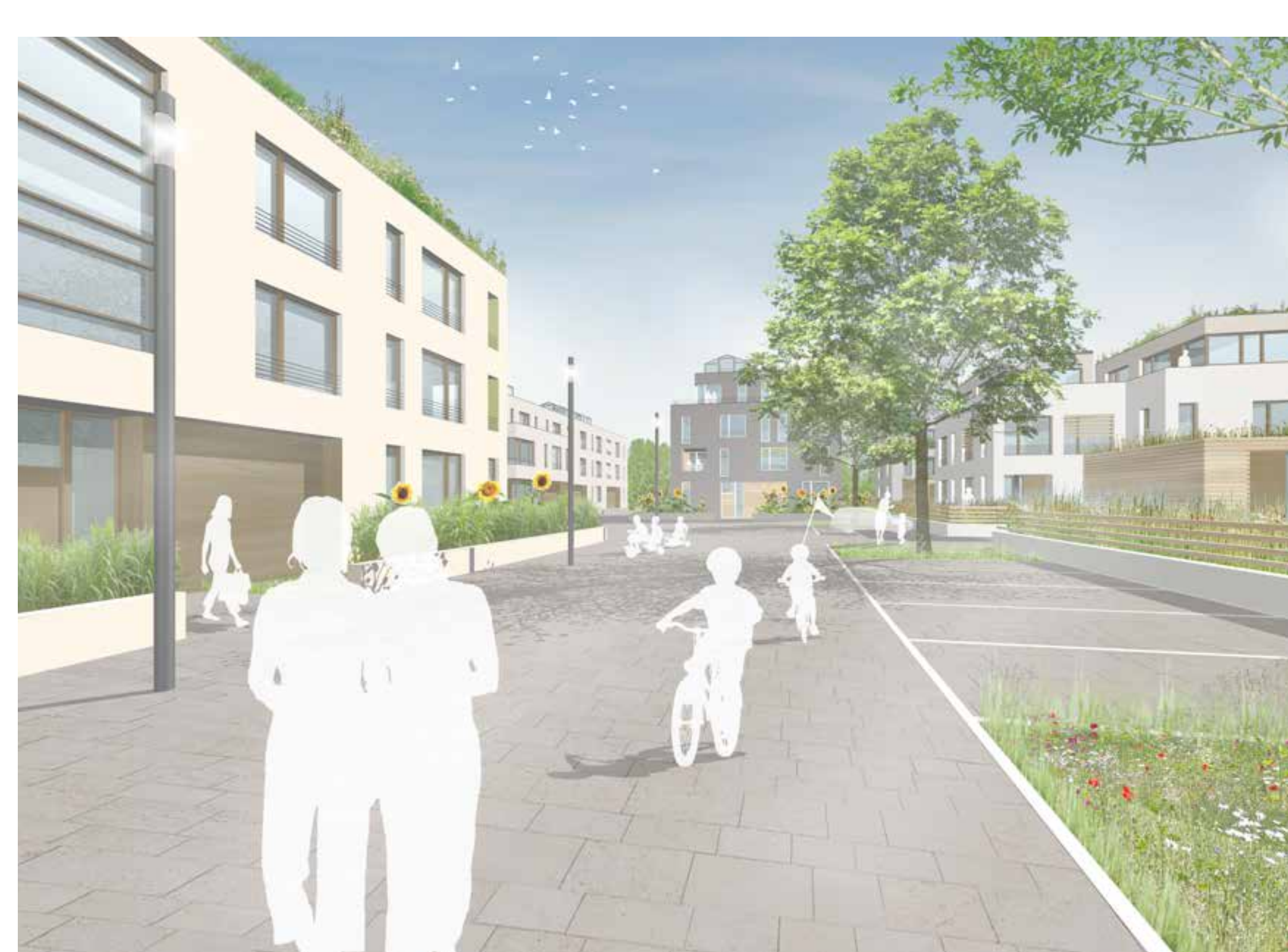
Wohnstraße im Westen