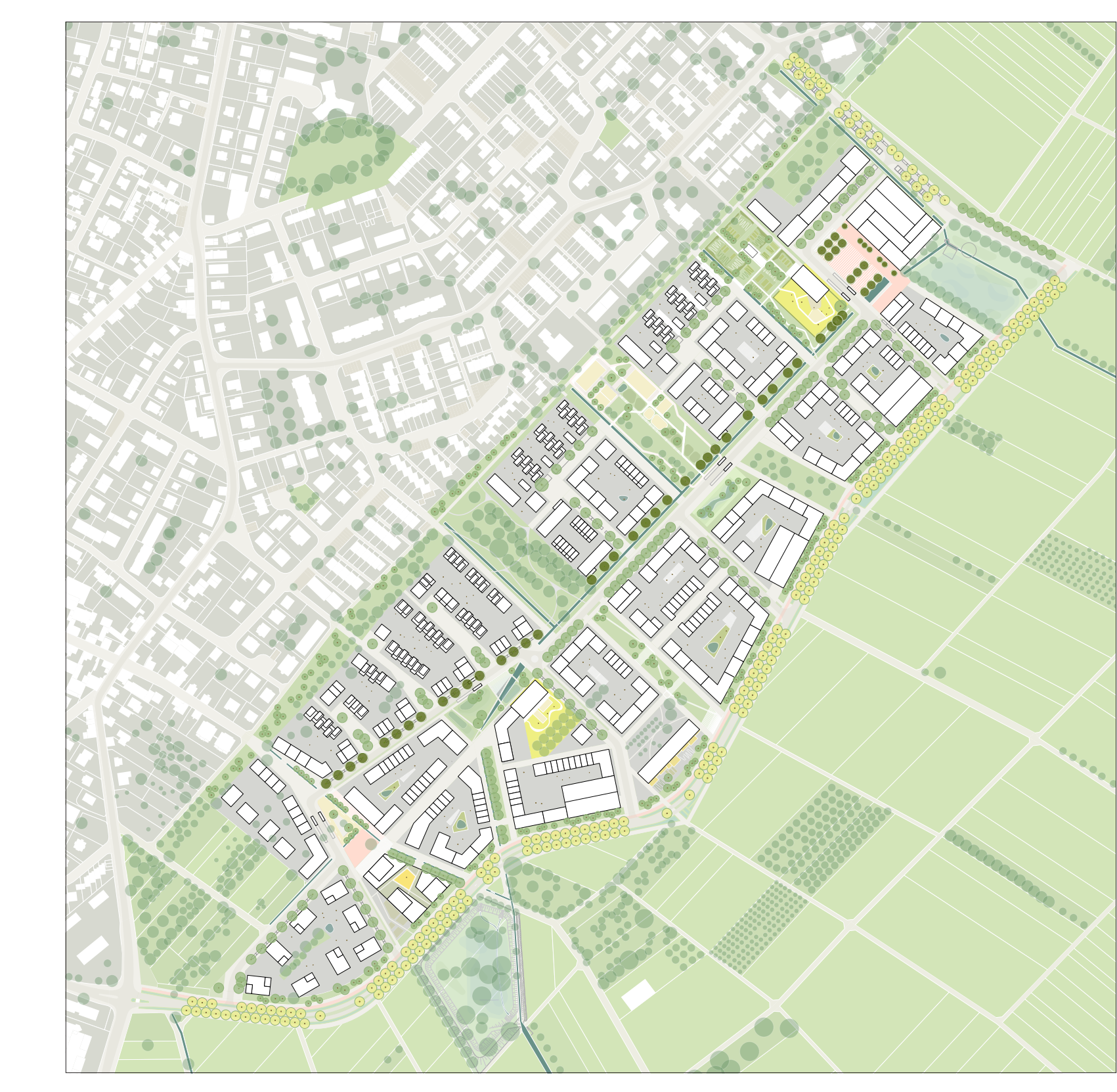
Freiraumkonzept M 1:5.000