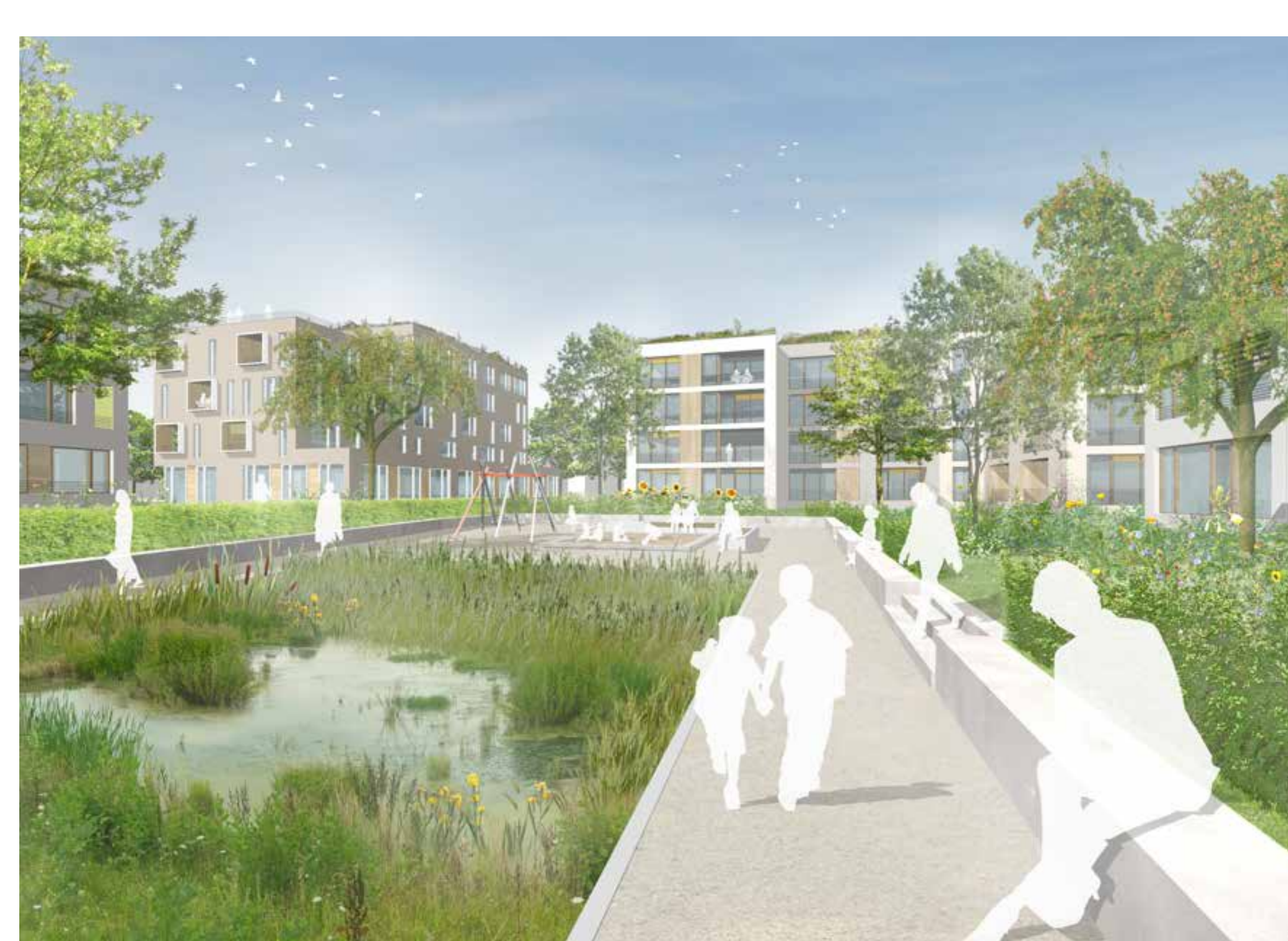
Wohnhof an der Römerallee