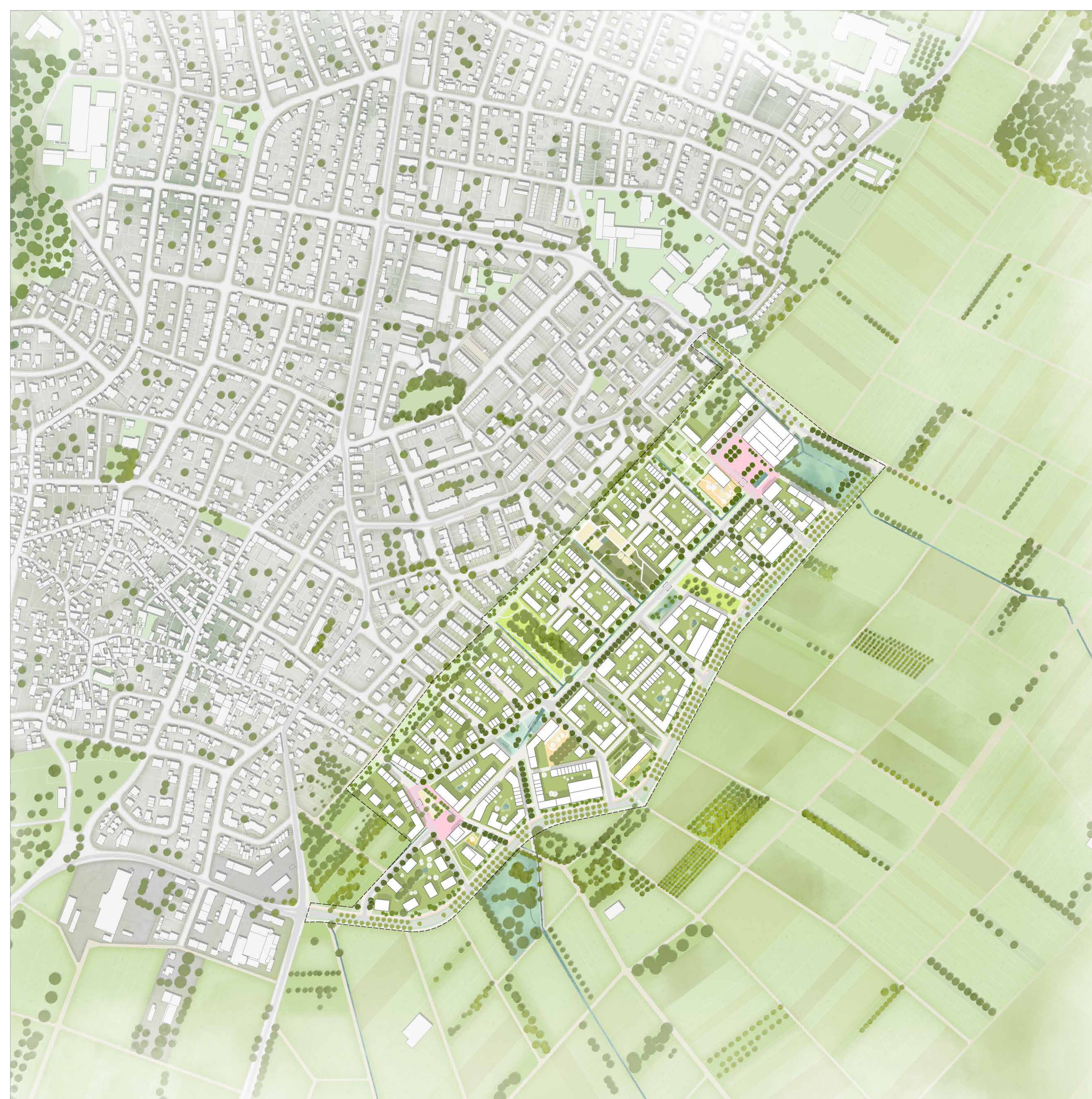
Strukturkonzept M 1:2.000