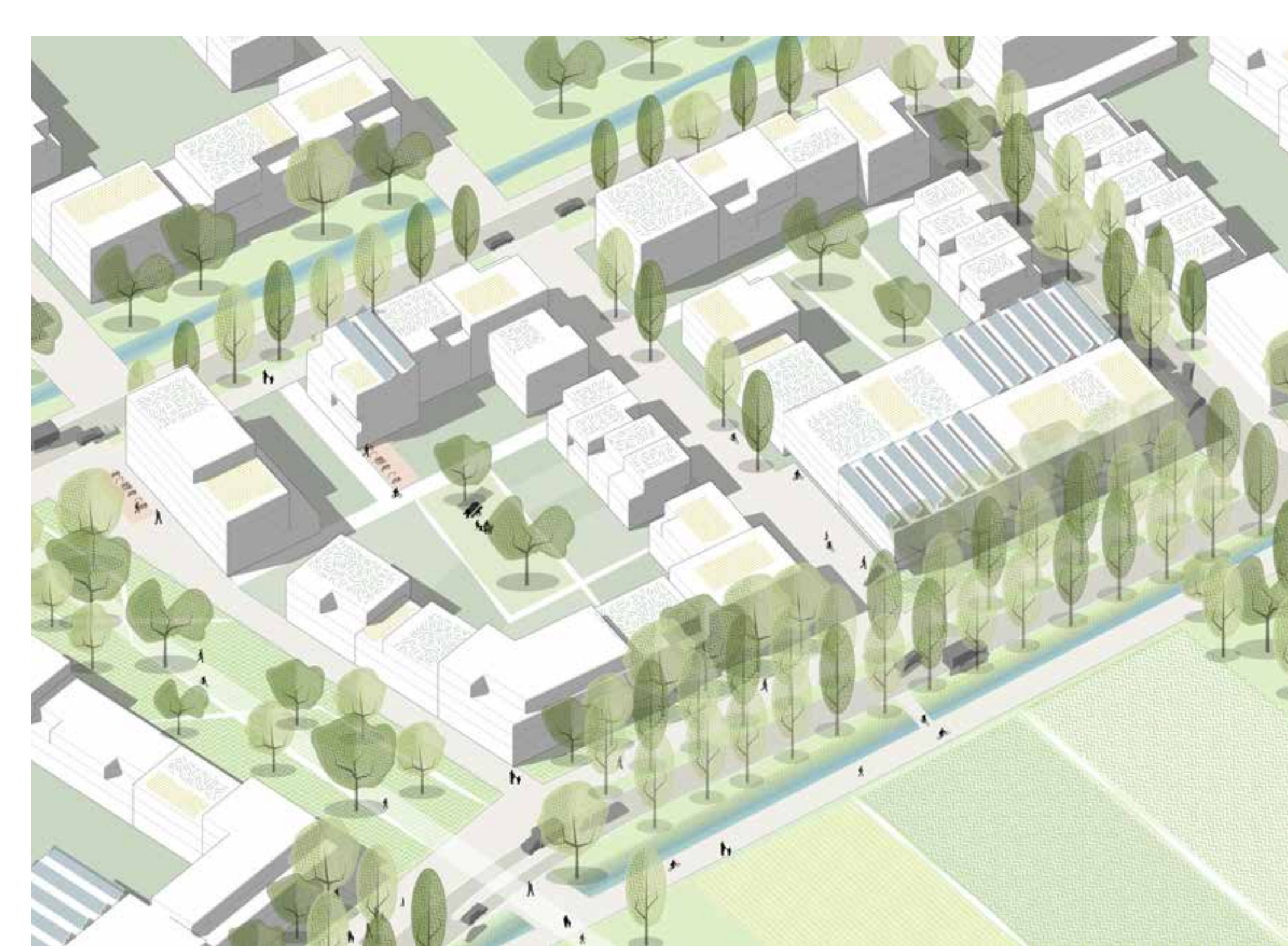
Wohnhöfe an der Römerallee