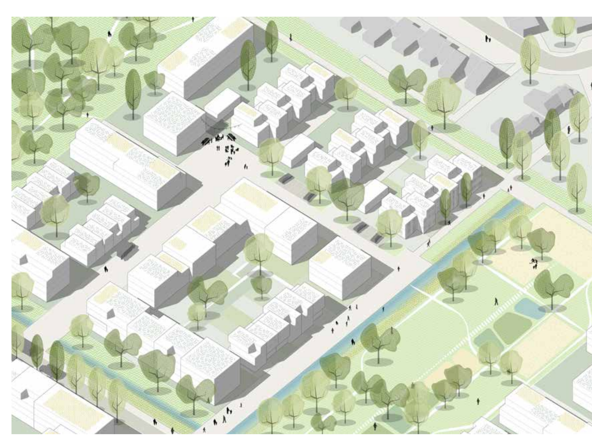
Wohnhöfe an der Elisabethenstraße