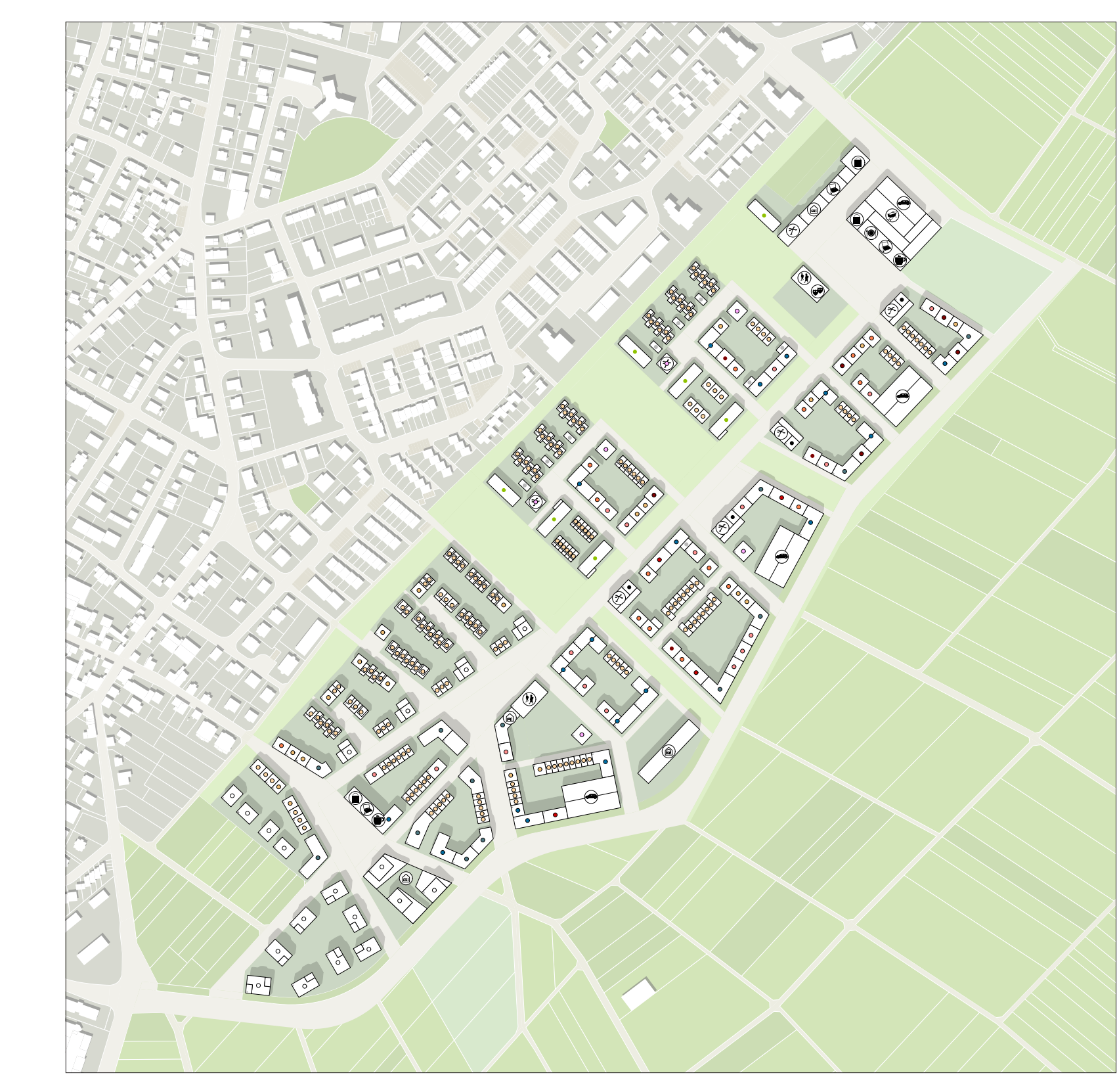
Bebauungskonzept M 1:5.000