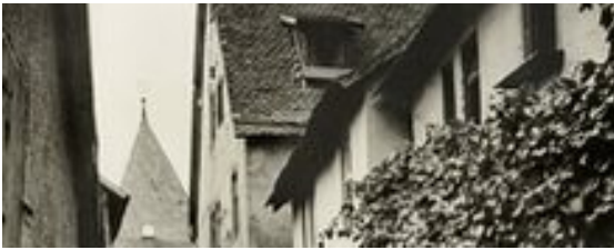
Ausschnitt aus der Aufnahme des Büttelturms