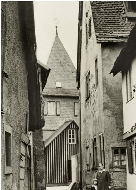
Aufnahme des Büttelturms von Josef Nix © Josef

HOFHEIM „Spotlights – Fundstücke aus dem Stadtarchiv“, so heißt ein neues Projekt auf der Seite des Hofheimer Stadtarchivs auf der Homepage www.hofheim.de .