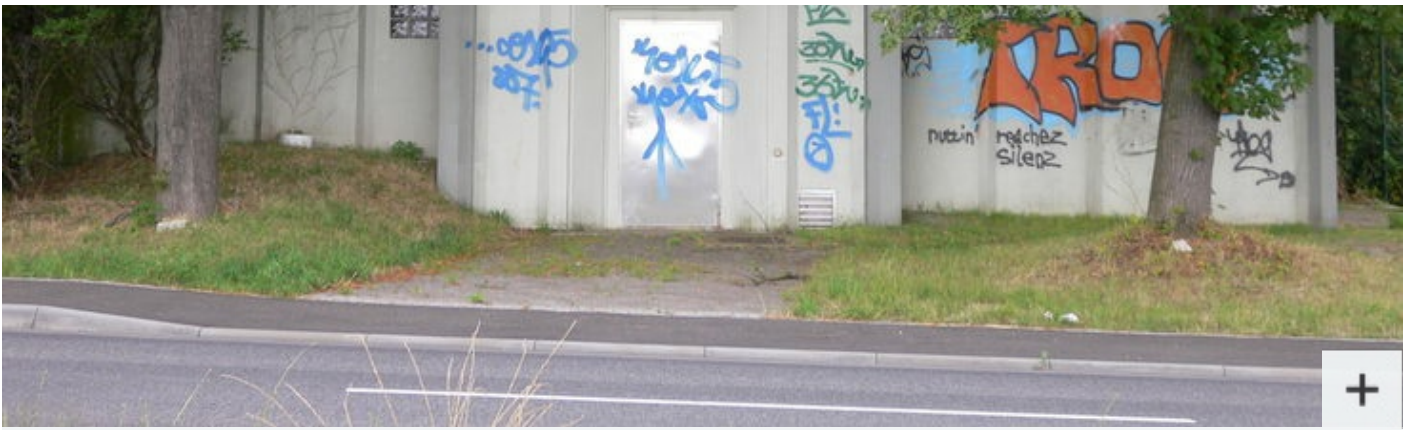
Außenansicht Wasserhochbehälter Wallau von 1927