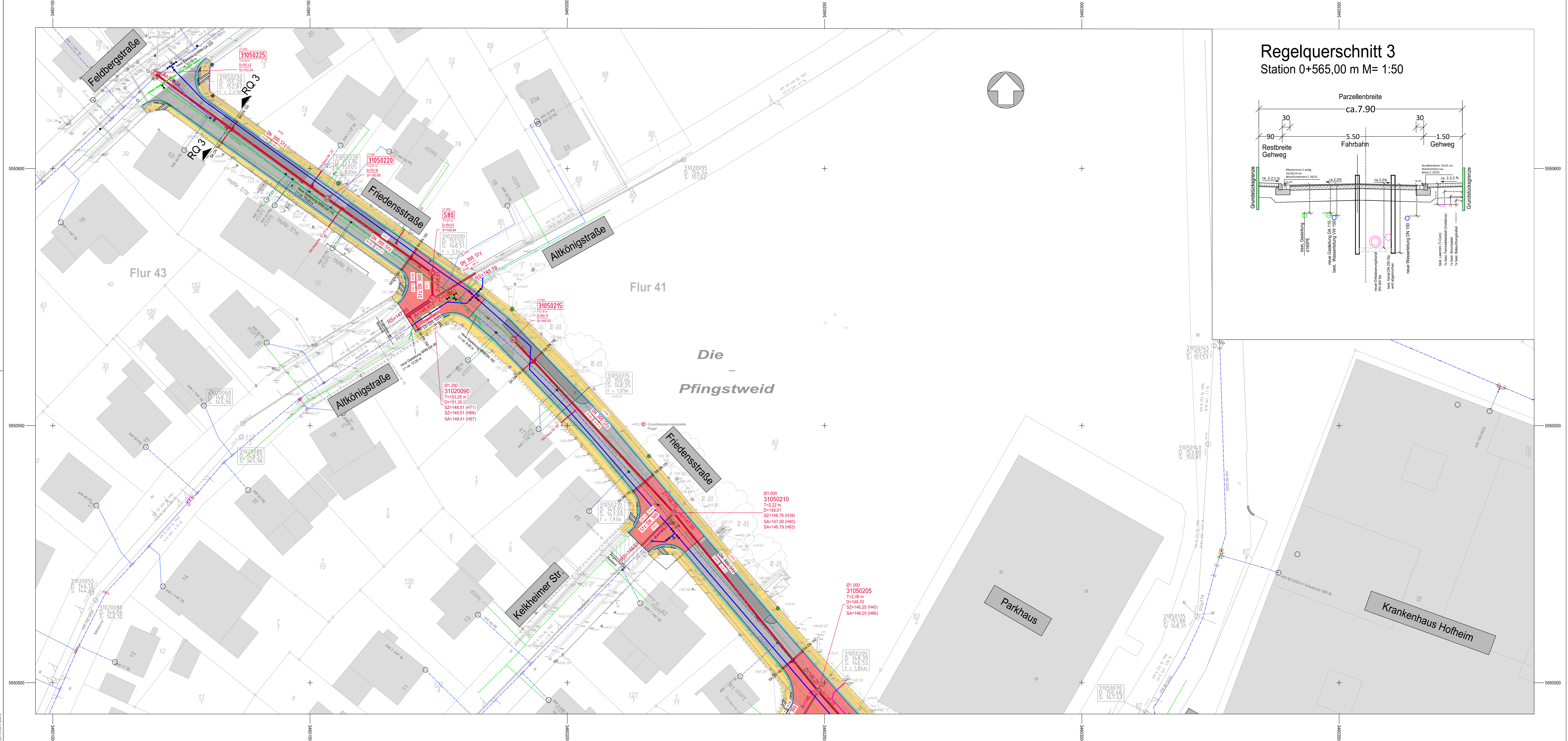
Regelquerschnitt 3 Station 0+565,00 m M= 1:50