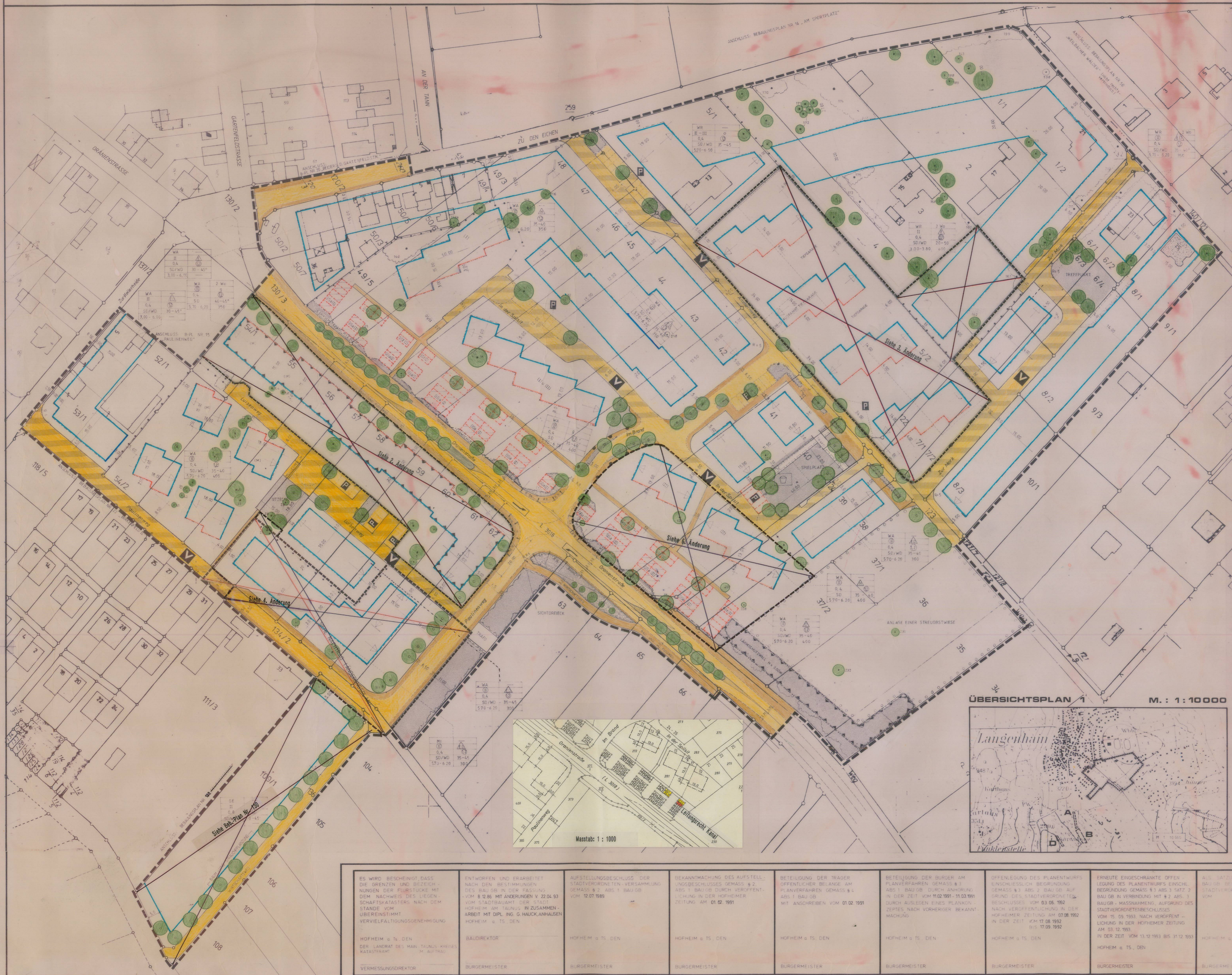
ÜBERSICHTSPLAN 1 M. : 1 : 10000