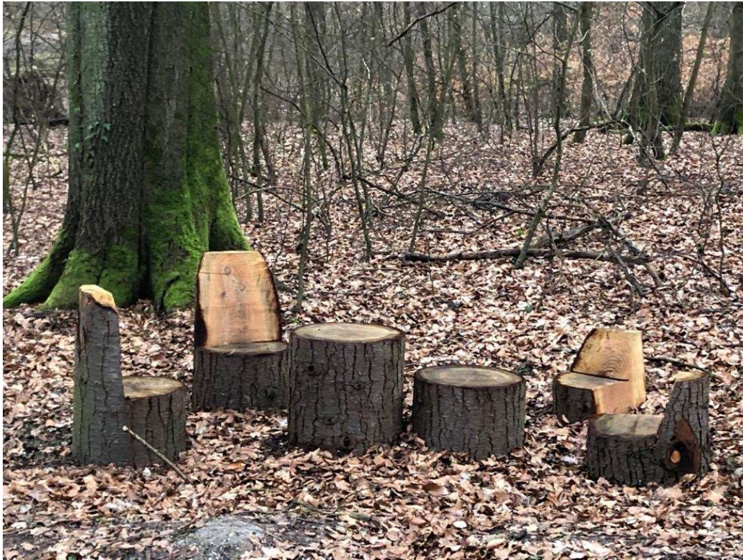
Abbildung 8 | „Sitzgruppe“ Abt. 9 Marxheim

Die Funktion des Hofheimer Stadtwaldes als Erholungswald beinhaltet den Wald als Erholungsraum für Waldbesucher. Der Wald als Ort, an dem man seine Freizeit verbringt oder Sport treibt.