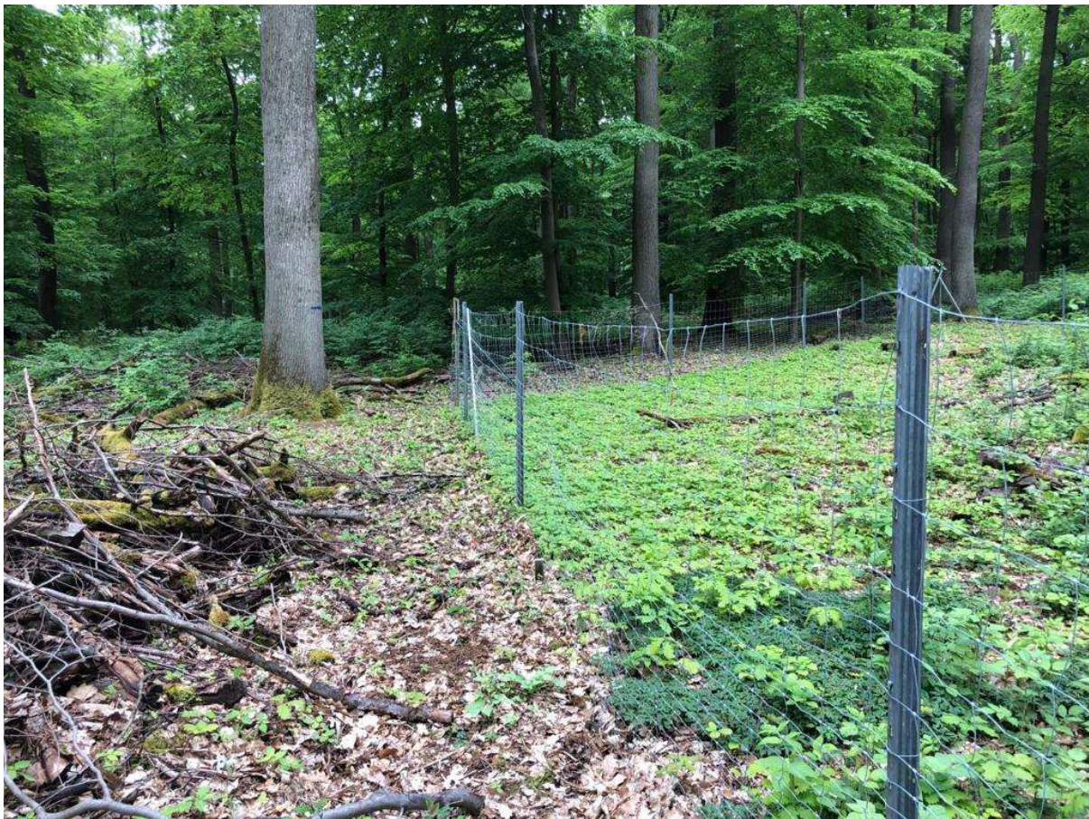
Abbildung 12 | Wildverbiss neben gezäunter Eichen-Naturverjüngung, Abt. 37 Hofheim

Leider ist die Verbissbelastung weiterhin sehr hoch. Die Auswertung der Weisergatter ergab einen Anteil von 26-53 % verbissener Jungbäume. Dies wird noch dadurch geschönt, dass der Anteil nicht verbissener Bäume fast nur aus Buchen besteht. Sonstige Laubbäume (Eiche, Ahorn, Kirsche, u.a.) sind zu nahezu 100 % verbissen.