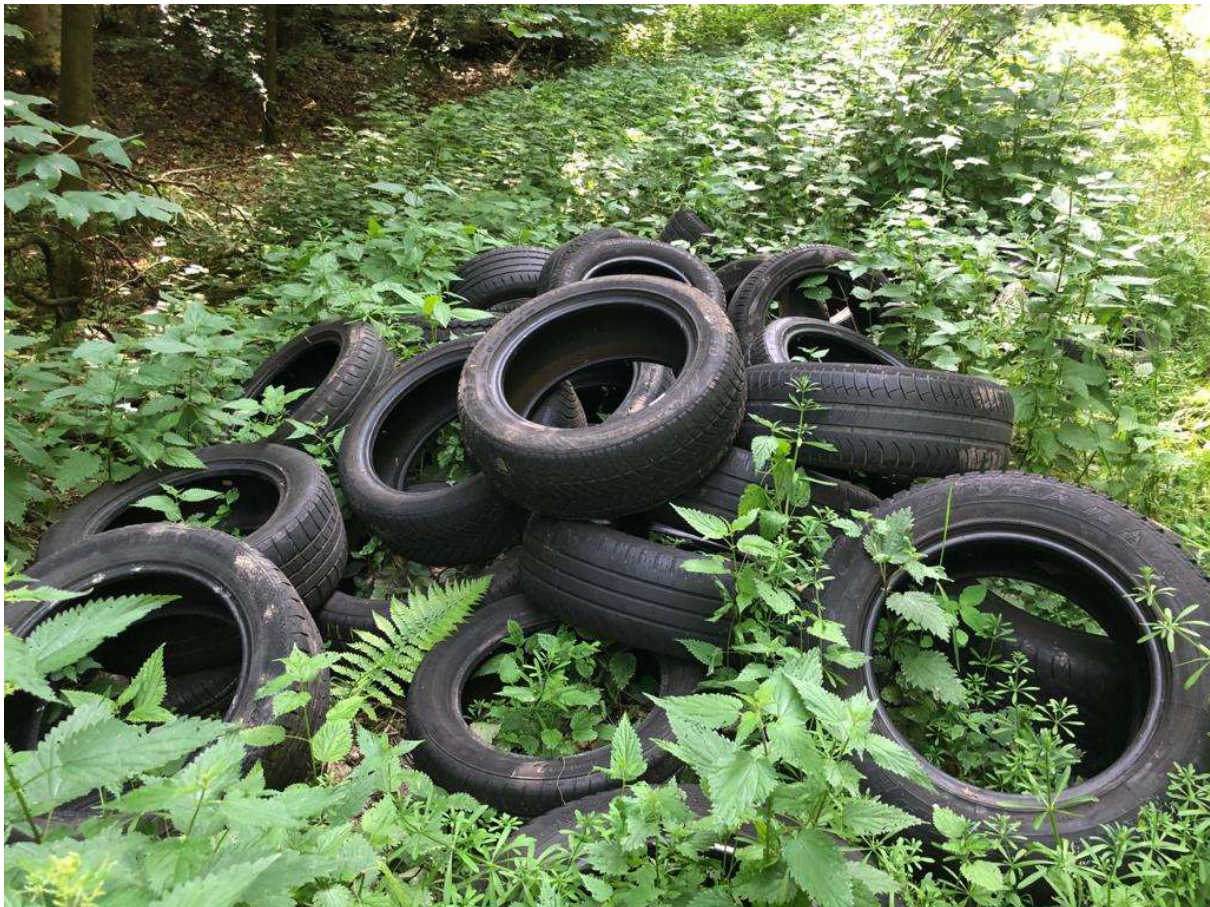
Abbildung 9 | Altreifen, Abt. 17 Eselsweg/Marxheim

Leider hat auch die Zerstörung und das beschmieren von Schildern, Hinweistafeln und Schranken zugenommen.