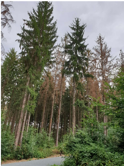
Abbildung 2 | Borkenkäferschäden an Fichten, Abt. 18

Insgesamt wurden ca. 350 Fm Sturmholz aufgearbeitet.