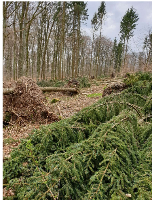
Abbildung 3 | Windwurf, April, Abt. 504 Wildsachsen