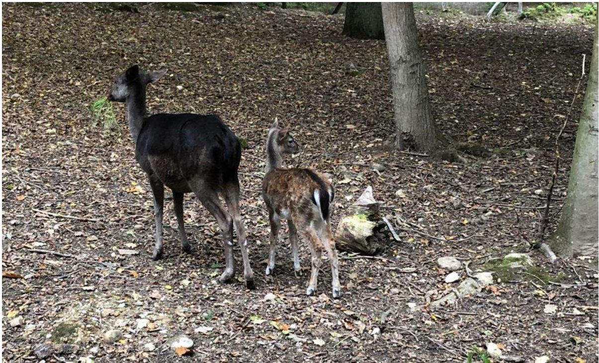
Abbildung 7 | Damhirschkalb im Wildgehege Kapellenberg

Im Wildgehege wurden Baumpflegemaßnahmen und Instandsetzungsarbeiten durchgeführt. Erfreulicherweise wurden 2020 zwei Frischlinge und ein Damhirschkalb geboren.