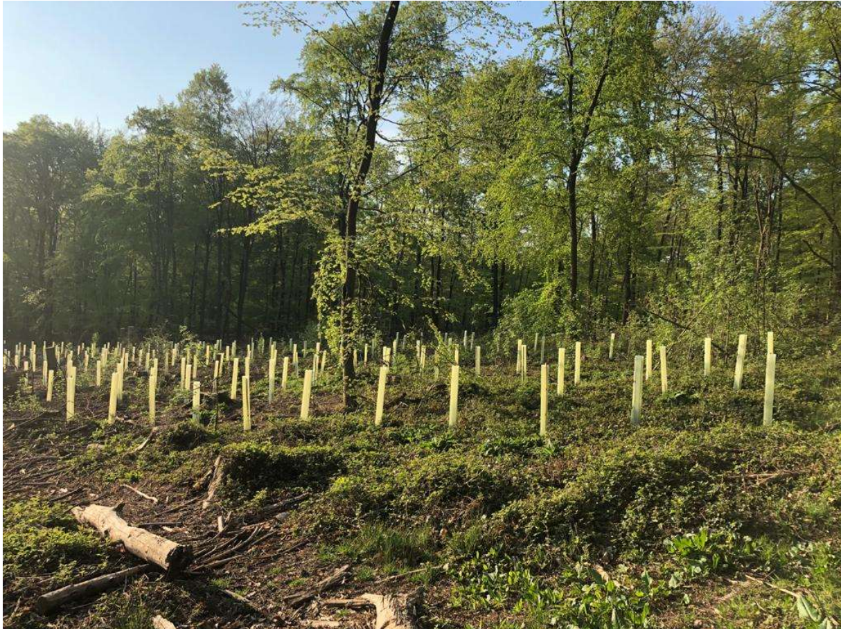
Abbildung 6 | Pflanzung mit Einzelschutz, Abt. 201, Langenhain

Die Aufforstung der Kahlfleichen ist damit leider nicht abgeschlossen. Dies wird noch einige Jahre andauern.