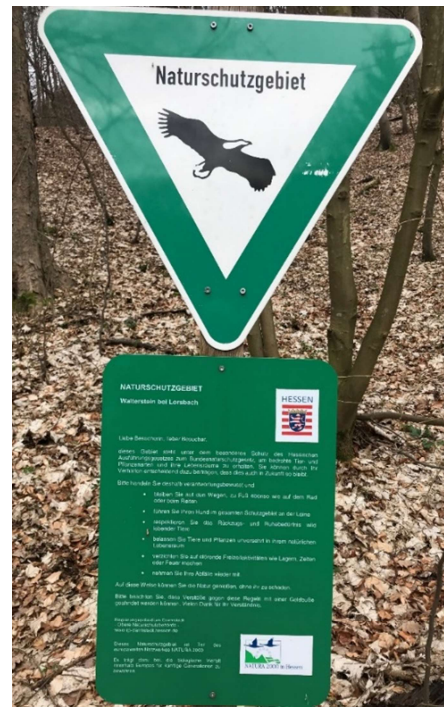
Abbildung 10 | Beschilderung Schutzwald

Mehrere Beobachtungsfelder wurden angelegt, um den zukünftigen Aufwuchs zu beobachten. Die Maßnahme wurde durch Mittel des Main-Taunus-Kreises gefördert.