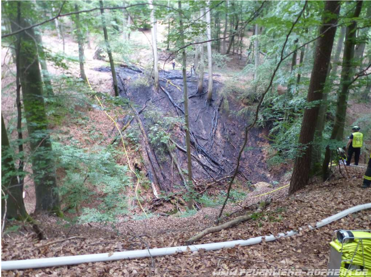
Abbildung 5 | Waldbrand 03.06.2020 Langenhain

Ob dies einzig auf die Trockenheit zurückzuführen ist oder, ob Brandstiftung vorlag, konnte bislang nicht geklärt werden.