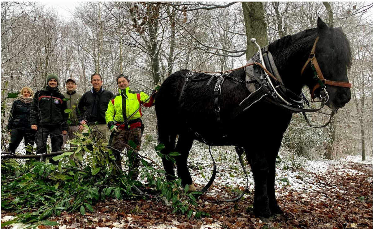
Abbildung 11 | Entfernung von Kirschlorbeer am Funkturm in Marxheim