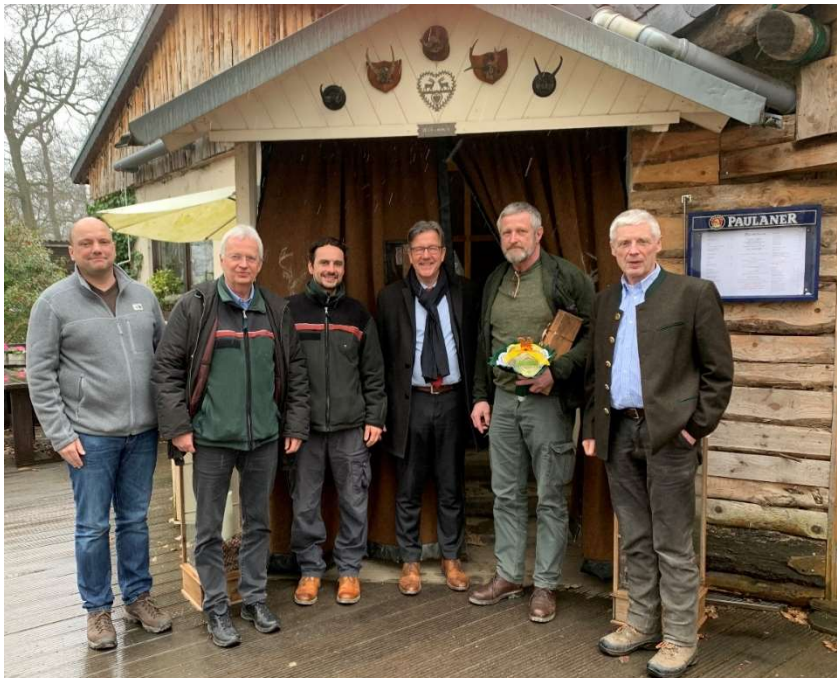
Abbildung 1 | Übergabe von Hessen-Forst

Unser erstes Jahr hat direkt in der wohl schwersten Krise der Forstwirtschaft begonnen. Trotz fast unüberwindbarer Schäden und viel Ungewissheit über die Zukunft der Wälder, sind wir zuversichtlich den Hofheimer Wald im Sinne seiner Bürger bewirtschaftet zu haben und auch zukünftig tun zu können.