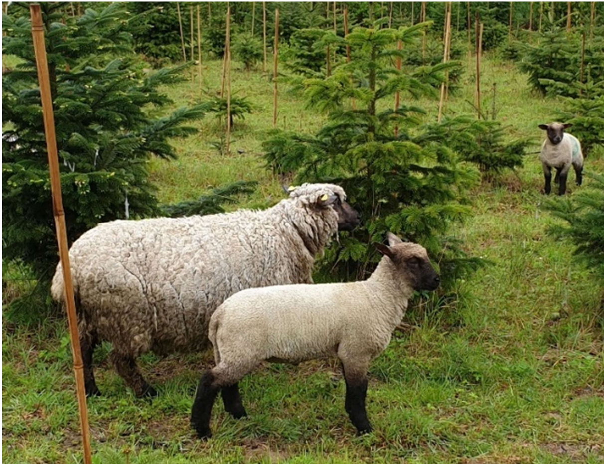
Abbildung 7 | Shropshire-Schafe in Weihnachtsbaumkultur Diedenbergen

Unsere Weihnachtsbaumkultur wird seit über einem Jahr durch Shropshire-Schafe gepflegt. Die Besonderheit bei dieser Schafrasse ist, dass sie nur das Gras fressen, die Triebe der Tannen aber nicht anrühren.