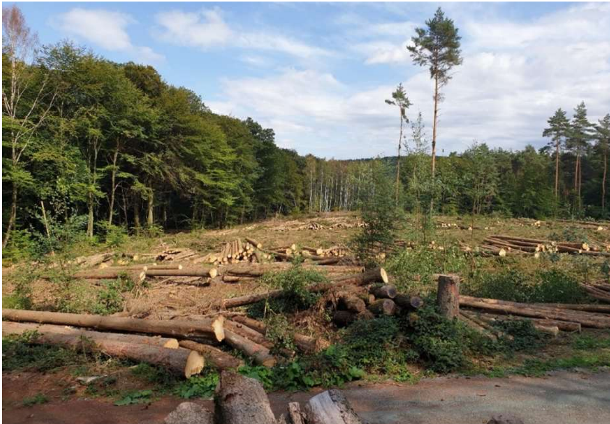
Abbildung 4 | Kahlschlag nach Borkenkäferkalamität Abt. 201 Langenhain

Befallene oder bereits abgestorbene Fichtenflächen wurden geräumt. Aus Verkehrssicherheitsgründen können nur selten abgestorbene Bäume oder ganze Bestände sich selbst überlassen werden.